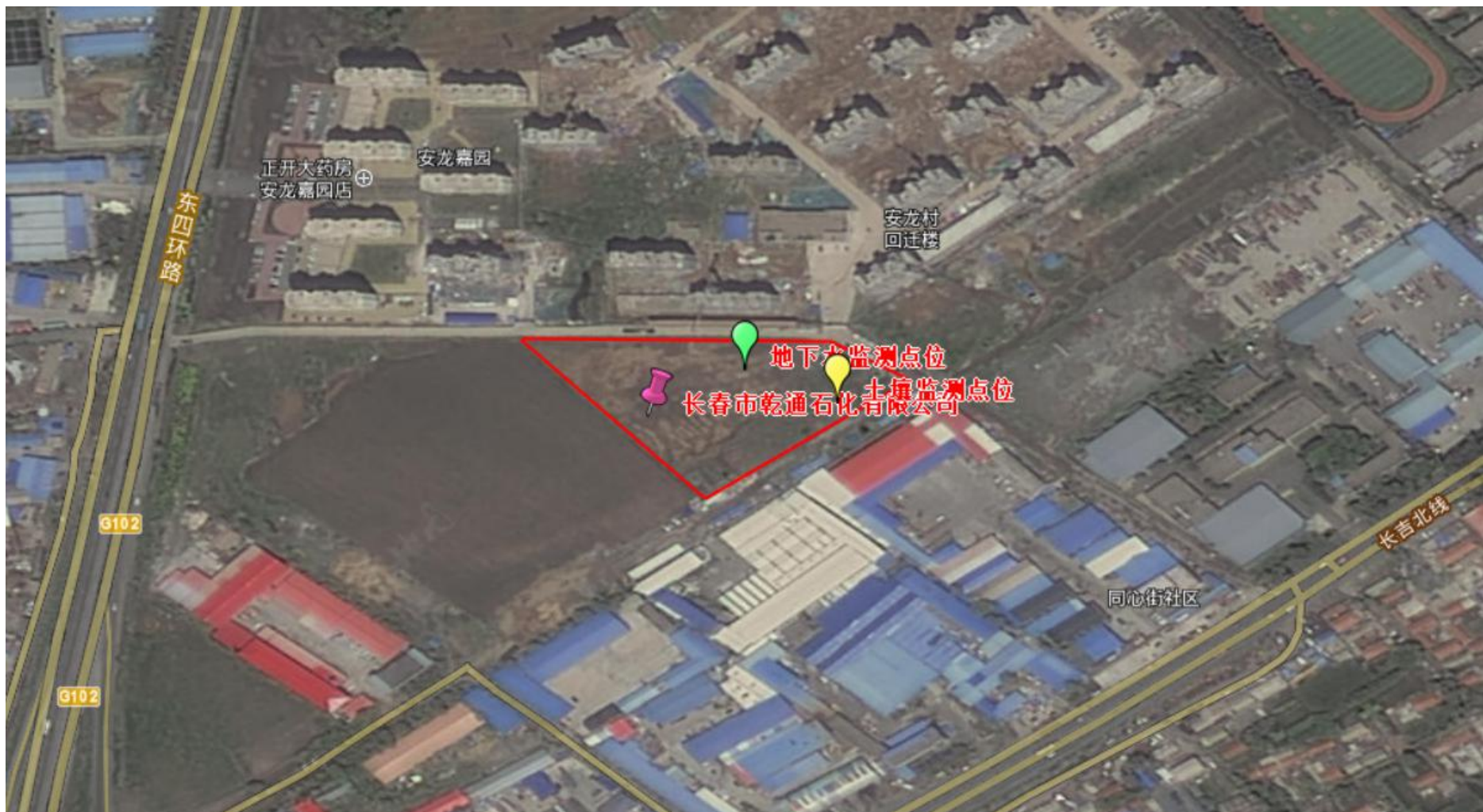
附图2 土壤及地下水监测点位图